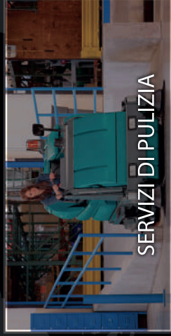
SERVIZI DI PULIZIA