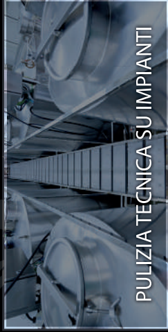
PULIZIA TECNICA SU IMPIANTI