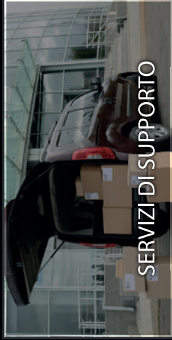
SERVIZI DI SUPPORTO