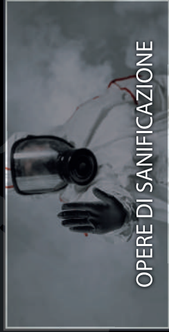
OPERE DI SANIFICAZIONE