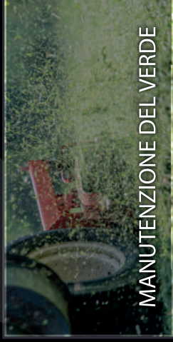
MANUTENZIONE DEL VERDE