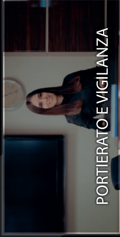
PORTIERATO E VIGILANZA